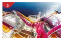
Waterslide Park Get drenched in fun on one of our six different waterslides.