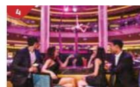
Bar 360 Catch live music and aerial acrobatic performances with a glass of champagne.