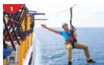
Ropes Course & Zipline Feel the thrill of gliding above the ocean on a 35-metre zipline.

ท่านสามารถรับประทานอาหารอย่างอิสระได้ตามห้องอาหารที่เรือเตรียมไว้ให้ และสามารถเข้าร่วมกิจกรรมที่ทางเรือจัดให้หรือพักผ่อนได้ตามอัธยาศัย