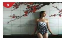
Crystal Life™ Spa Rejuvenate mind, body and soul with our holistic Western and Asian spa experience.