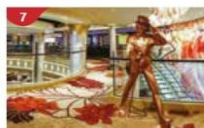
Johnnie Walker House™ Immerse yourself in the intricate world of premium Scotch whisky.