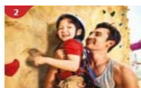
Rock Climbing Wall Challenge yourself on our mountainous rock climbing wall.