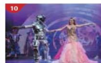
Zodiac Theatre Enjoy live production shows from the acclaimed award-winning entertainment team.