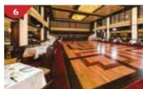
Dream Dining Room Savour a wide variety of Asian and international cuisine.